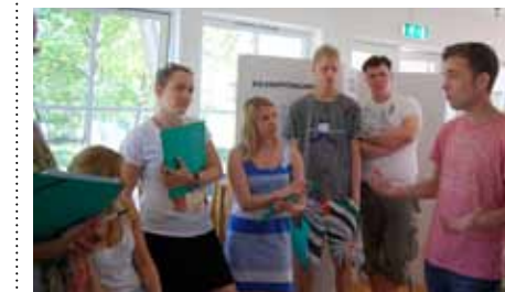
Under årsmötet diskuterar vi i stora och mindre grupper om vad vi vill utveckla i SCUF.

Är du anmäld kommer du också få vara med om flera roliga aktiviteter. Det är också ett bra tillfälle att träffa medlemmar från andra regioner runt om i landet.